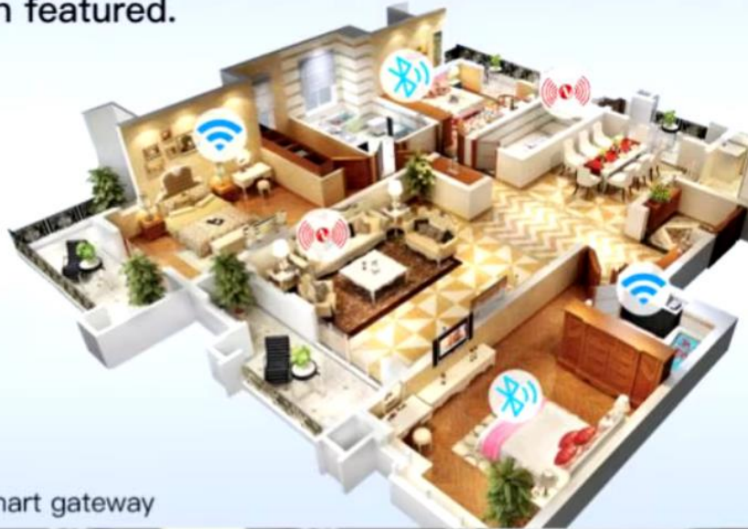
All-in-one powerful smart gateway

Wireless remote control your smart devices under one same interface for added convenience